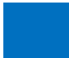
Code 234 Bleu

Les renseignements fournis par la présente Fiche Technique sont donnés de bonne foi, à titre indicatif. Ils ne sauraient en aucun cas induire une garantie de notre part, ni engager notre responsabilité lors de l'utilisation de nos produits. Cette Fiche Technique annule et remplace toutes les versions antérieures. Compagnie France Chimie se réserve le droit d'apporter toute modification à ses produits et à cette fiche technique sans avis préalable. Notre clientèle voudra bien s'assurer, avant toute mise en œuvre, que la présente notice n'a pas été modifiée par une édition plus récente qui prendrait en compte des données techniques nouvelles.